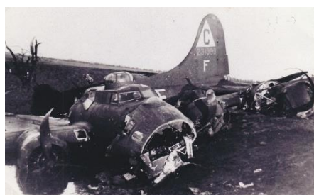
Neergestorte Amerikaanse bommenwerper tussen Wijk bij Duurstede en Amerongen op 22 februari 1944

Wist u dat in de Grote Kerk na de capitulatie heel veel krijgsgevangen gemaakte Hollandse soldaten een nacht op stro geslapen hebben en te eten kregen? Dat er een Amerikaanse bommenwerper en een jachtvliegtuig in Wijk zijn neergestort? En dat er Joden en ook heel veel onderduikers zijn verborgen? Zo is er veel te vertellen. In de lezing komt het optreden van Hitler bij het begin van de Tweede Wereldoorlog ter sprake en zal een link naar Poetin niet ontbreken. De avond wordt georganiseerd door BovenWijks, het aanbod voor ontmoeting en bezinning van onze gemeente.